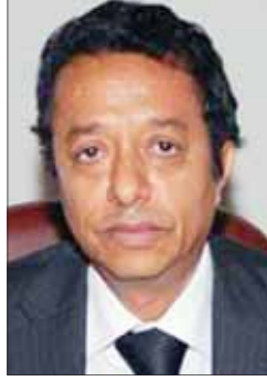
عبد الملك السعودي

توقع وزير الشؤون القانونية الدكتور محمد الخلفي أن يتم استكمال مناقشة مشروع قانون استرداد الأموال المنهوبة وإقراره من قبل مجلس الوزراء في اجتماعه القادم وكذا مناقشة وإقرار مشروع قانون العدالة الانتقالية والمصالحة الوطنية إذا لم يكن هناك أية أعاقات لمشروع القانونين. وقال الوزير المخلفي في تصريح لـ "الثورة" إن مشروع القانونين تم صياغتهما وفقاً لمرحلات الحوار الوطني للملحة للجميع من خلال اللجان الفنية التي تم تشكيلها لهذا الغرض واستيعاب ملاحظات الرأي العام حول مشروع قانون استرداد الأموال المنهوبة وعقد ندوات وورش عمل حول مشروع قانون العدالة الانتقالية.