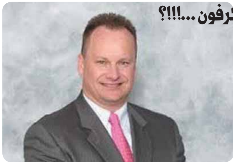
• بسبب النيمية مدير عام التربية بولاية نيويورك يقدم استقالته

" ري كوت " رئيس مجلس إدارة مدارس ولاية نيويورك ( مدير عام التربية ) لم يتخيل إن سخريته من ولية أمر أحد الطلاب ستؤدي إلى خسران وظيفته ... والذي حصل أنه في آخر اجتماع لأولياء أمور الطلاب في مدرسة " ماهاباك " وبعد انتهاء الاجتماع كان يتحدث مع إحداهن بجواره عن هذه المرأة وقال عنها إنها " سميئة " ووزنها يزداد أكثر وأكثر . ولسوء حظه كان الميكرفون مفتوحاً وكذلك كانت كاميرا القاعة .. وبعد ذلك تم تسريب الفيديو إلى إحدى محطة ( القناة السابعة ) التي بثته .. كما تم إنزال الفيديو على موقع " اليوتيوب " وهذا أجبر ري كوت على إعلان استقالته يوم الثلاثاء الماضي من رئاسة مجلس إدارة المدارس بالولاية .. كما أعلن سحب إعادة ترشيح نفسه في الانتخابات لنفس المنصب .. وبعدها قدم اعتذاراً علنياً للمرأة أمام مجلس إدارة أولياء أمور الطلاب . ويعرف عن الضحية أنها أم لستة أطفال كما أنها عملت مع إدارة المدارس ست سنوات كمتطوعة .