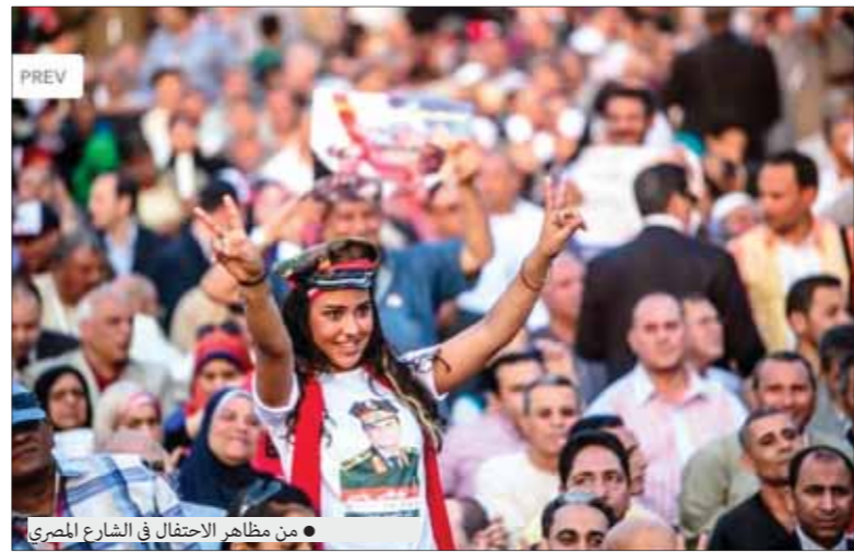
من مظاهر الاحتفال في الشارع المصري