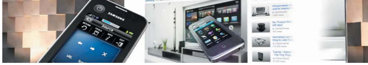
ذكاء التلفزيون والتلفون أثر على الصحافة الورقية بشكل كبير.

• في ولاية أركنساس كانت هناك مطاردة بالسيارات (عام 2004م) بين الشرطة وشابين في الطريق المجاورة لنهر المسيسيبي وانتهت المطاردة بمصرع السائق والراكب الذي بجواره... والسبب هو أن أحد الأضواء الرئيسية لسيارة الشاب لا تعمل ولهذا أوقفه رجل الشرطة وعندما أمره بالخروج من السيارة انطلق الشاب بالسيارة مما دفع رجل الشرطة إلى القيام بملاحقته وطلب مساعدة إضافية لاعتقاده أن الشاب خطير أو يحمل ممنوعات أو مطلوب للعدالة... وأضافت وكالة الاسيوشيتد برس التي