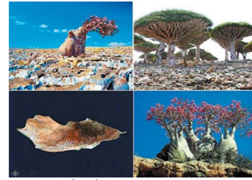
• الطبيعة الساحرة لجزيرة سقطرى تجذب الأجانب أكثر من اليمنيين...!!!