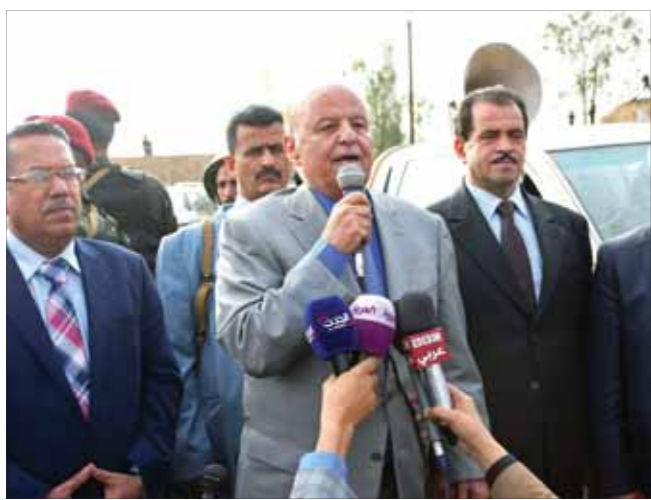
.. ويلقي كلمة أمام منتسبي اللواء التاسع مدرع

مخرجات الحوار أكدت على نزع السلاح وعدم المواجهة بين أبناء الشعب وعلى كافة القوى التنافس بالبرامج