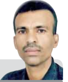
محمد بن عبد الرحمن

دعا وزير الشباب والرياضة معمر الإرياني منظمات المجتمع المدني الشبابية إلى المساهمة الفاعلة في التوعية بمخرجات الحوار الوطني، وذلك خلال اللقاء التشاوري الذي استعقدته وزارة الشباب والرياضة بالتعاون مع وزارة الشؤون الاجتماعية والعمل واتحاد شباب اليمن خلال سبتمبر المقبل بمشاركة واسعة للمنظمات الشبابية والعاملة مع الشباب والذي يهدف إلى إشراك هذه المنظمات ومساهمتها العملية الانتقالية والتوعية بمخرجات الحوار وثقافة الأقاليم وكذلك حشد الدعم المالي اللازم من قبل المنظمات الدولية لتنفيذ البرامج والأنشطة وخلق شراكة واسعة.