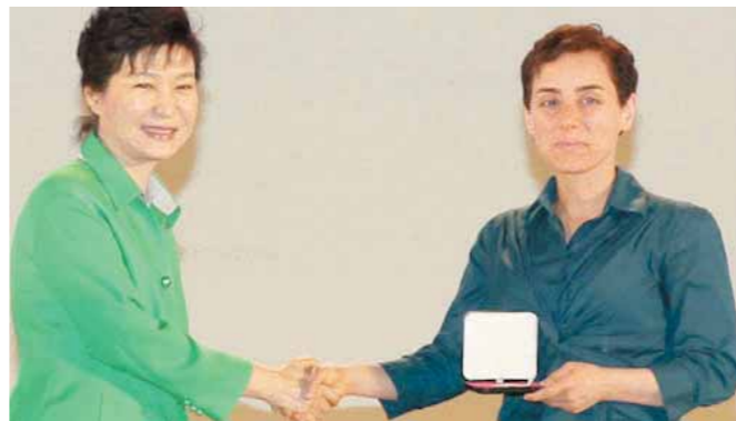
• مريم ميرزاخاني تم تكريمها من الرئيسة جين هاي وهي أيضاً أول امرأة تتقلد منصب رئيس جمهورية في جنوب كوريا.

يخفف من آلام طنين الأذن وهذا عكس ما كان معروفاً من قبل... إذ كان يتم تقديم النصيحة للمصابين بهذا المرض بأن لا يتناولوا المشروبات التي فيها مادة الكافيين مثل البن... وأضافت صحيفة " ذا اميركان جورنال أوف ميدسن " والتي نشرت الخبر في عددها لهذا الشهر أن مستشفى النساء هنا ببوسطن في ولاية ماساتشوستس أجري دراسة علمية على 65 ألف امرأة وتبين أن تناول القهوة يساعد على التخفيف من آلام طنين الأذن... ومع ذلك لم يستطع الباحثون الجزم بالمستوى الذي تعالج فيه مادة الكافيين هذه الآلام وإلى أي درجة ممكنة..!!