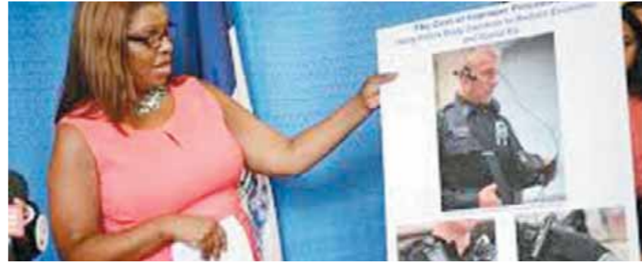
• لتيتيا جيمس المحامية العامة لمدينة نيويورك تعرض مشروع حماية الشرطة بالكاميرا.

المدينة بكاميرا فيديو يتم تركيبها على جسد رجل الشرطة لتسجيل كل شيء يتم أثناء القبض على المجرمين وغيرهم... وفي هذا الخصوص قامت لتيتيا جيمس المحامية العامة لمدينة نيويورك بعرض الفكرة والمشروع في مؤتمر صحفي عقدته الاثنين الماضي بالمدينة وقالت إن هذا المشروع سيكلف سلطات المدينة من 450 إلى 900 دولار للكاميرا الواحدة ولكنه سيوفر ملايين الدولارات. وأضافت صحيفة ديلي نيوز التي نشرت الخبر في موقعها (11 أغسطس) أن مدينة نيويورك كان آخر دفعياتها للدفاع عن أعمال رجال الشرطة قد وصل إلى 152 مليون دولار... بسبب أن المتهمين والمقبوض عليهم يتهمون رجال الشرطة بالتعسف وارتكاب الأخطاء ثم يرفعون عليهم قضايا في المحاكم... وبهذا الإجراء التكنولوجي سيتم توفير الملايين إلى خزينة المدينة... ويذكر هنا أن إحدى مدن ولاية كاليفورنيا قد اعتمدت هذا النظام واستطاعت أن تقلص دعاوى المرفوعة ضد الشرطة بنسبة 88%.