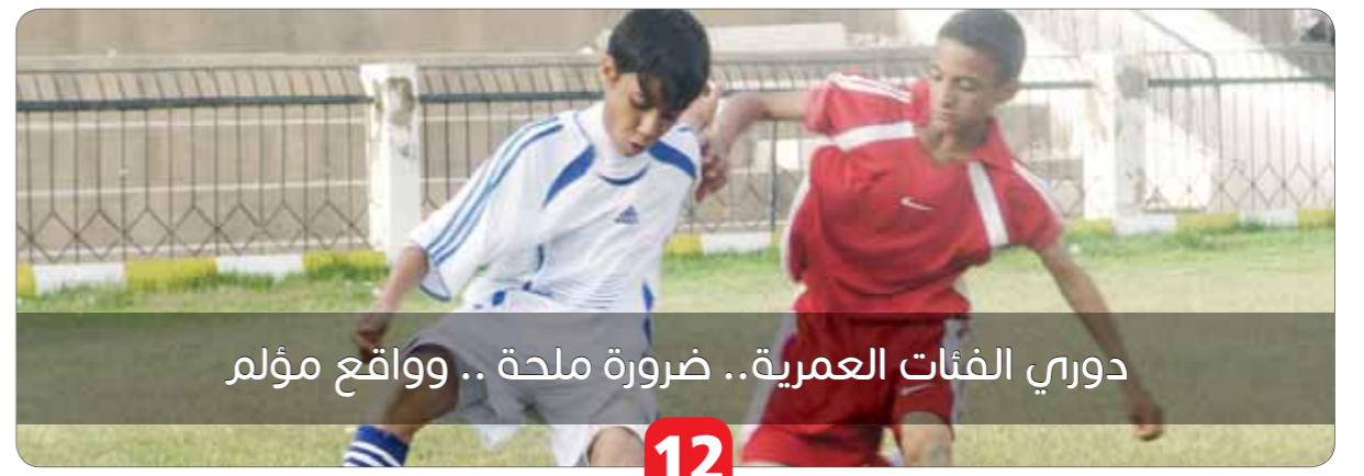
دوري الفئات العمرية.. ضرورة ملحة.. وواقع مؤلم