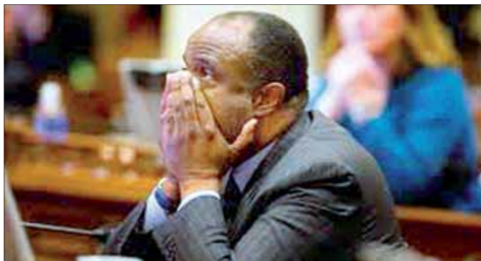
السيناتور راد رايت في المحكمة التي حكمت عليه بالسجن 3 أشهر

السيناتور "راد رايت" عضو مجلس شيوخ ولاية كاليفورنيا استقال الاثنين الماضي من منصبه ليس لأنه شفيط الملايين أو كان يستلم أموالاً مشبوهة أو وظف مجموعة وهمية كحراسة شخصية أو تورط في قتل مواطنين أو فشل لعمل شيء لدائرتة الانتخابية.. إنما كذب "كذبة بيضاء" عندما رشح نفسه للانتخابات (2008م) وسجل في البيانات عنواناً غلط محل إقامته