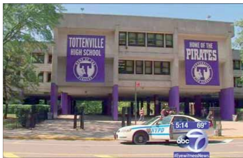
ثانوية توتنيفال أقرت هذه السنة إجراءات صارمة لمنع ارتداء الملابس "المشخصة"